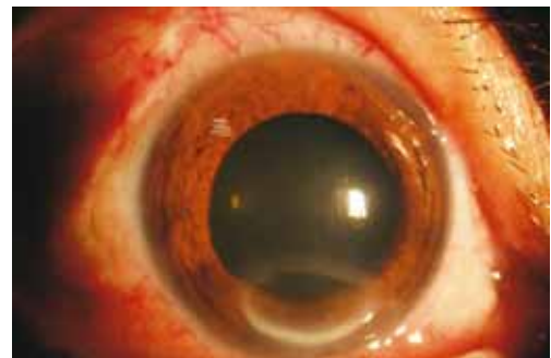
图3 患者,女,糖尿病性视网膜病变(5期),玻璃体切割术后2wk出现角膜下方椭圆形浅基质溃疡,羊脂状KP(+),停止原眼药水点眼联合小牛血清提取物凝胶点眼及地塞米松球周注射后10d无明显好转,行临时性睑裂缝合术,7d痊愈、拆线。