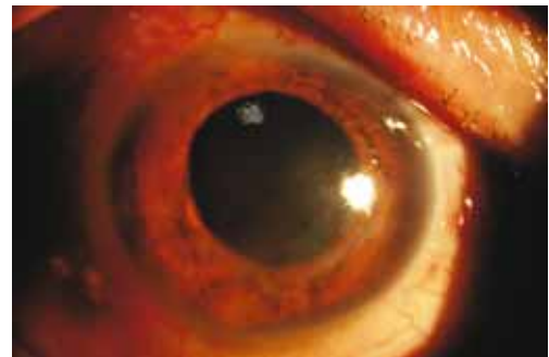
图2 患者,男,糖尿病性视网膜病变(5期),玻璃体切割术后2wk出现角膜下方不规则形浅基质溃疡,羊脂状KP(+),停止原眼药水点眼联合小牛血清提取物凝胶点眼及地塞米松球周注射后10d痊愈,遗留角膜云翳。