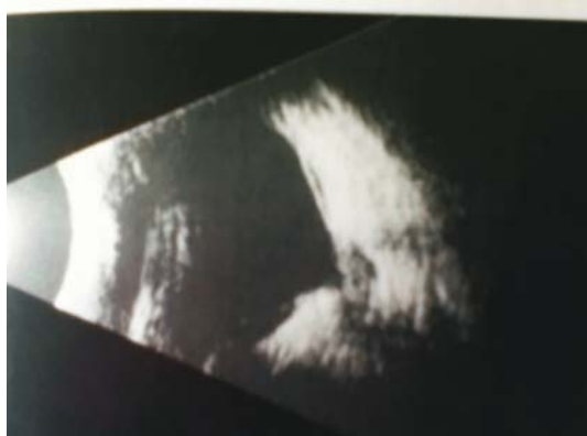
图4 B超检查 视盘及周围组织向眼球后极部凹陷、扩大,玻璃体腔后部呈倒置的“瓶颈状”回声图像,瓶颈轮廓显示分明,凹陷底部界限清楚,凹陷内可见不规则弱回声。

眼严重视力障碍,破坏了双眼视觉集合功能引起右眼知觉性内斜视 [3] ,通过斜视矫正手术可以达到美容效果。本例