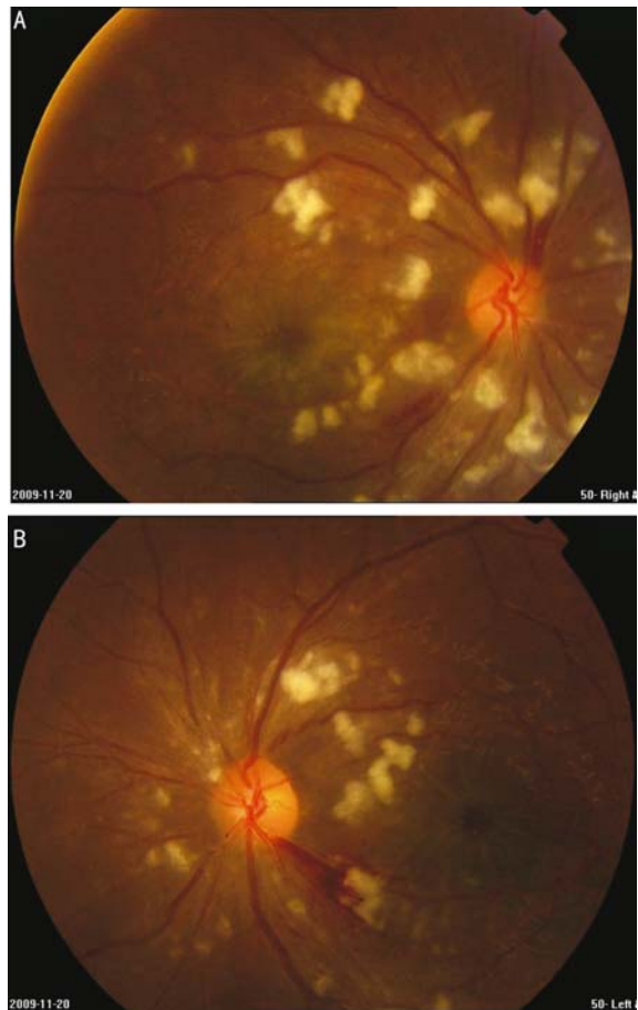
图 1 彩色眼底照相检查: 双眼视盘下方边界欠清, 双眼静脉轻度迂曲, 右眼底静脉鼻上分支和颞下分支可见少量出血, 左眼静脉颞下分支可见小片火焰状出血, 双眼视盘周围视网膜散在棉絮斑, 双眼黄斑区可见星芒状渗出 A: 右眼; B: 左眼。

SLE 是一种病因不明的自身免疫性疾病, 累及多个器官, 眼部表现 [3,4] 主要为干燥性角结膜炎、溃疡性睑缘炎、巩膜炎和眼底病变。其发病机制主要是 SLE 所产生的免疫复合物在眼部沉积而破坏正常眼部组织。SLE 患者视网膜血管屏障功能损害严重, 其视网膜病变的典型表现是棉絮斑, 棉絮斑可以是孤立的或者散在多个出现, 可伴或