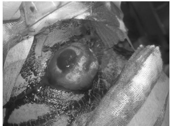
图1 右眼球脱出于眼眶外,眼球结构尚完整。

眼球脱臼是由于多种原因造成眶压增高,驱使眼球向前脱出于睑裂之外。眼球脱臼根据程度不同分为眼球半脱臼和眼球全脱臼。其原因包括外伤、眶内出血、血管瘤及鼻窦的肿瘤,甚至胸腔腹部压力急剧增高也可引起眼球