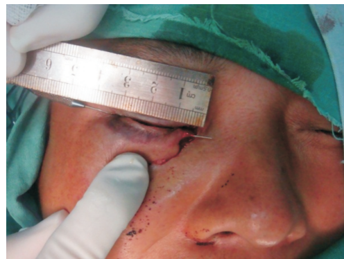
图 1 远端距测量方法:Bowmann 泪道探针支撑泪管,测量泪小管断裂远端至泪小点的距离。

1.1 对象 回顾性研究 2016-01/2017-08 就诊于上海交通大学医学院附属第九人民医院眼科泪小管断裂者。纳入标准:(1)外伤到接受手术治疗的时间均 <48\text{h} ;(2)患者均单侧受伤;(3)行 I 期泪小管吻合手术治疗且手术由同一手术医生完成。排除标准:(1)既往先天性或后天性眼睑内眦部畸形、泪道畸形病史;(2)既往有内眦部或鼻泪道损伤或手术病史;(3)未经手术治疗(例如患者及家属要求保守治疗);(4)术后失访或 3 次正规随访缺失。按照以上纳入、排除标准,共入选患者 87 例 87 眼,年龄 18