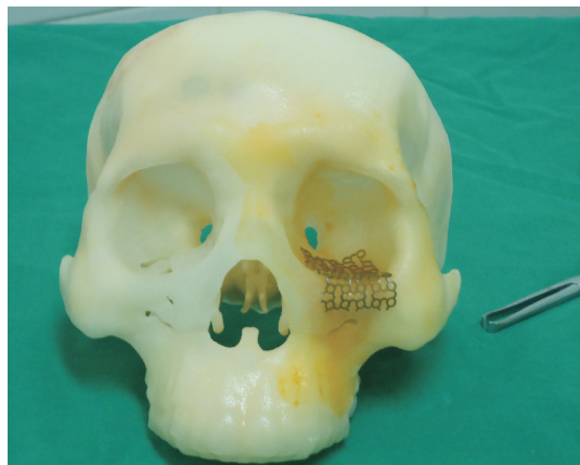
图 1 实体头模。

疗效判定标准: 治愈:眼眶形态良好,眶区饱满,眼球运动正常,复视消失;改善:眶区凹陷、眼球运动改善,复视减轻;无效:双侧眼球凹陷>2mm 眼球运动、复视无改善。